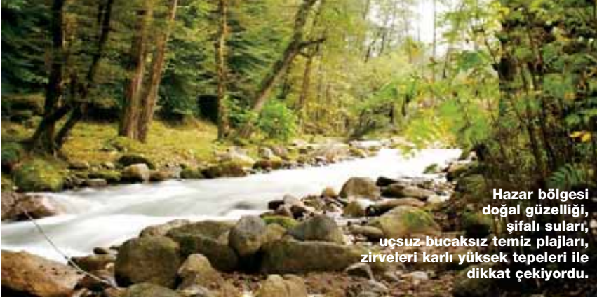
Hazar bölgesi doğal güzelliği, şifalı suları, uçsuz bucaksız temiz plajları, zirveleri karlı yüksek tepeleri ile dikkat çekiyordu.

Lak'ların bölgeyi terk etmesi, Novolak'ta Çeçenlerin Avarlar üzerinde sayıca üstünlüğü ele geçirmesine sebep olacaktır. Ortaya çıkacak olan yeni durum, Çeçenlerin Novolak'ın Çeçenistan'a geri verilmesini talep etmelerine zemin hazırlayacaktır. Bu da ister istemez, etnik gerginliğe sebep olacaktır.