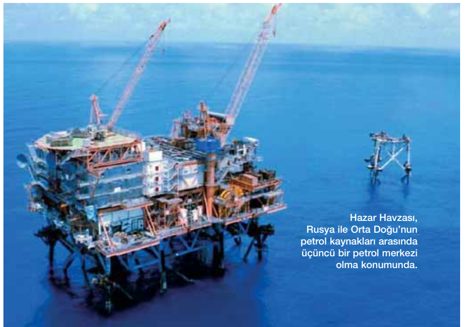
Hazar Havzası, Rusya ile Orta Doğu'nun petrol kaynakları arasında üçüncü bir petrol merkezi olma konumunda.

Bilindiği gibi, Kafkasya'da üç önemli geçit mevcuttur. Söz konusu geçitler, özellikle Rusya için hayati önem taşımaktadır. Bunlardan birisi Hazar boyunca uzanan "Derbent Geçidi"dir. İkincisi, Rusya'nın 19. asırda yaptırdığı askeri Gürcistan yolunun geçtiği "Daryal Geçidi"dir. Üçün-