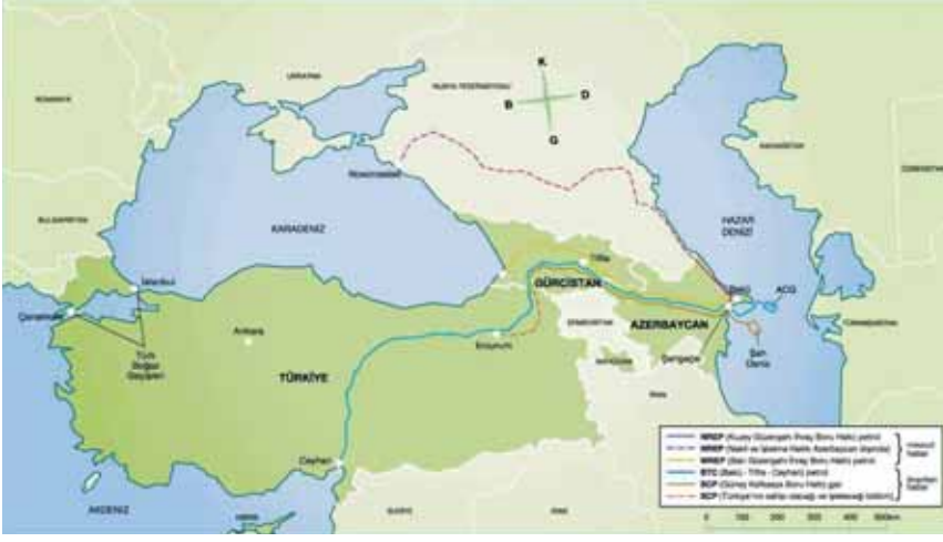
Batılı ülkeler, Bakü-Ceyhan boru hattını koruma bahanesiyle bölgeye seyyar özel birlikler yerleştirilmiştir.

cüsü ise Karadeniz sahilindedir. Son bir kaç yıldır Kafkasya'daki olaylar özellikle Karadeniz sahili ve Daryal'da baş göstermektedir. Derbent yolunu ise Rusya'ya karşı cihat ilan eden Çeçenler kesmiştir.